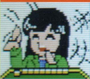
オクトパシーふみ

運B、血液型B、技術D、総合ランクC。ホンイツ大好き。日本タコ友の会の会員ナンバー001。タコ。